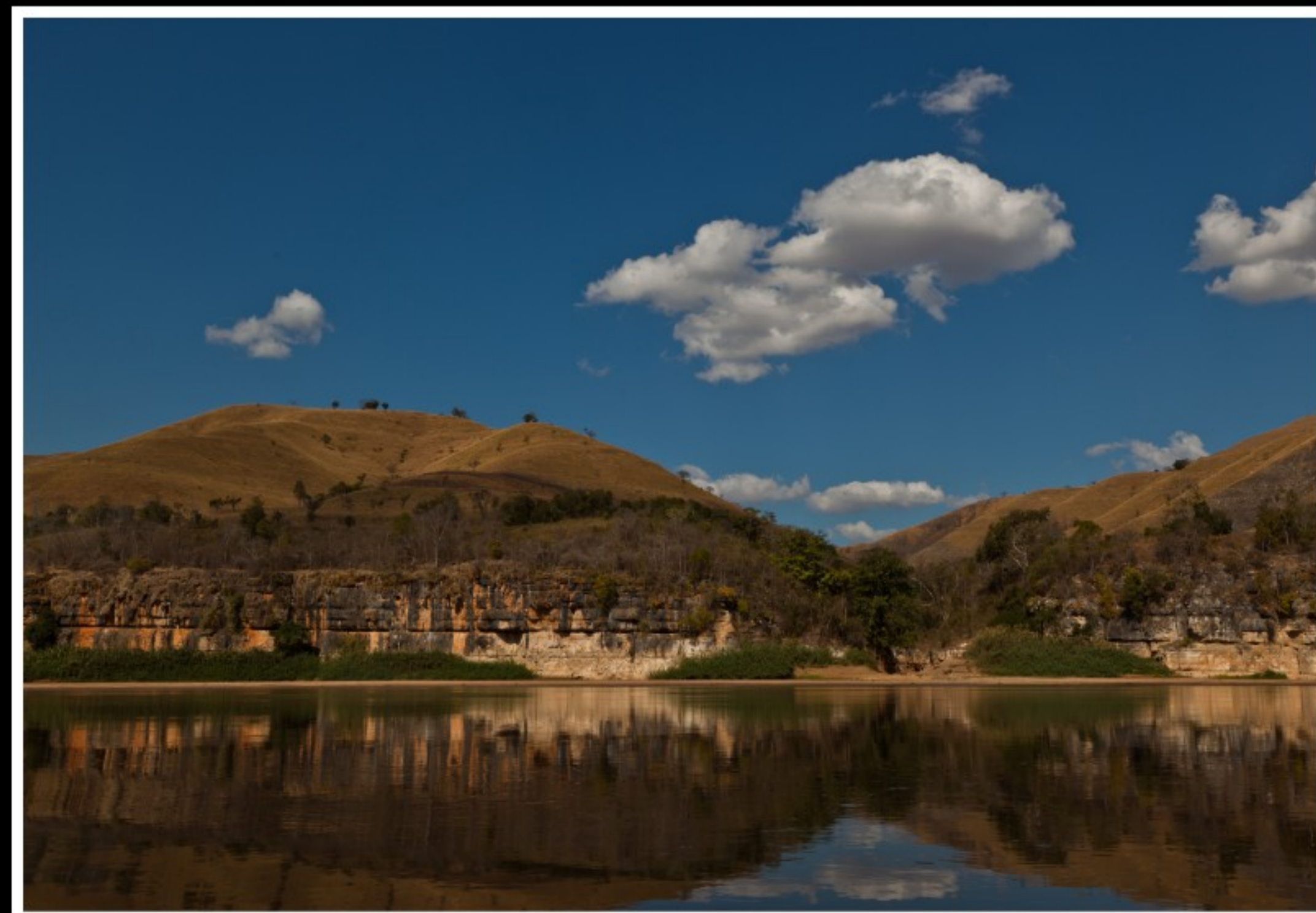
FAHRT AUF DEM FLUSS TSIRIBIHINA ...