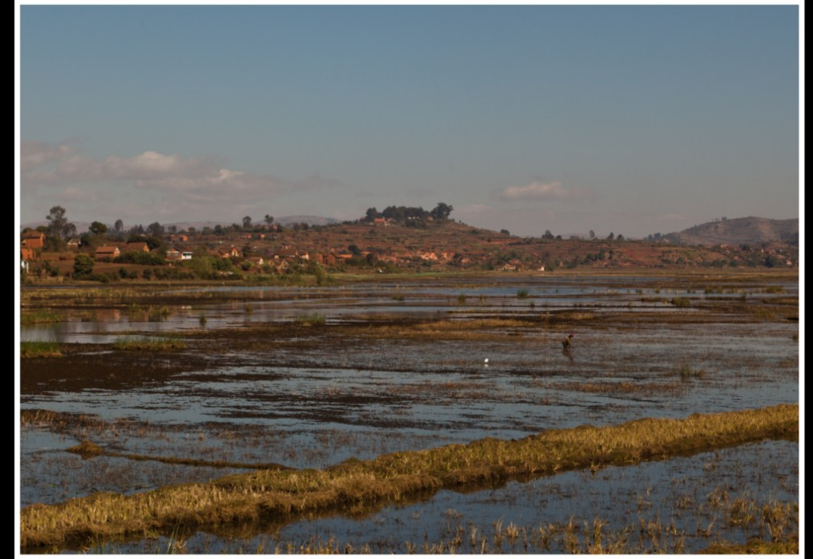
UNTERWEGS ZWISCHEN ANTSIRABE UND MIANDRIVAZO ...