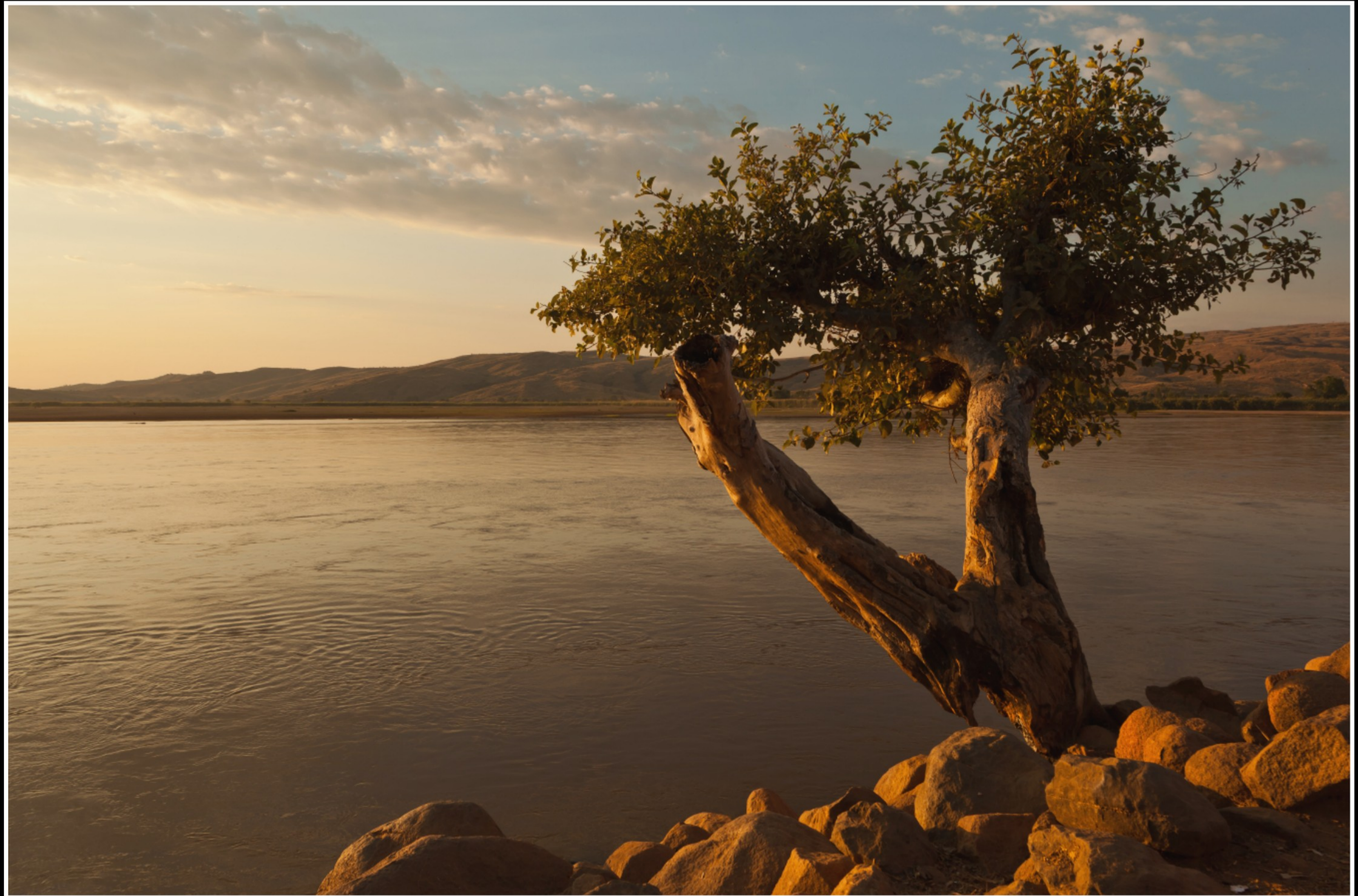
SONNENUNTERGANG IN TSIRIBIHINA ...