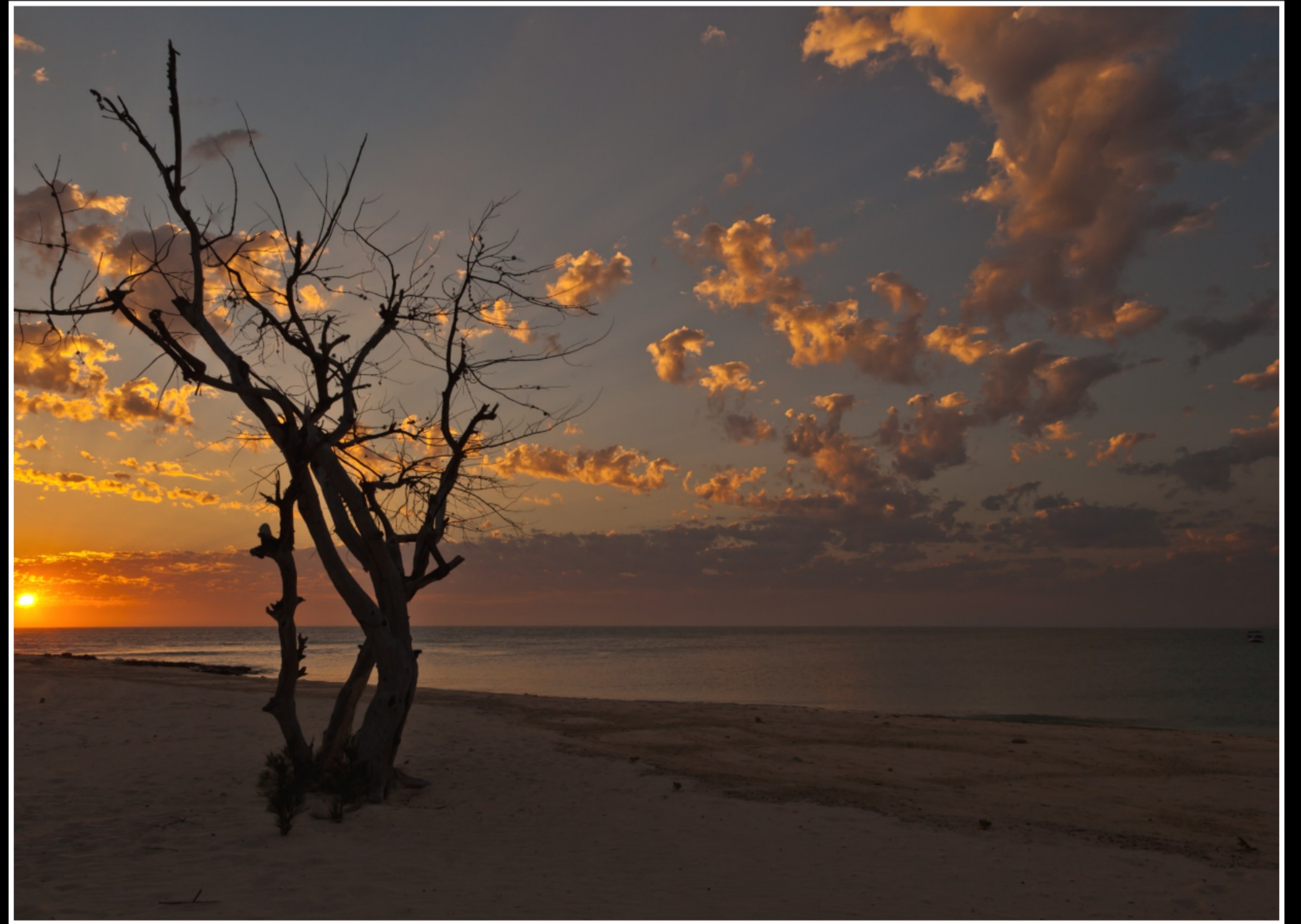
... IM ERHOLUNGS-PARADIES SALARY ...