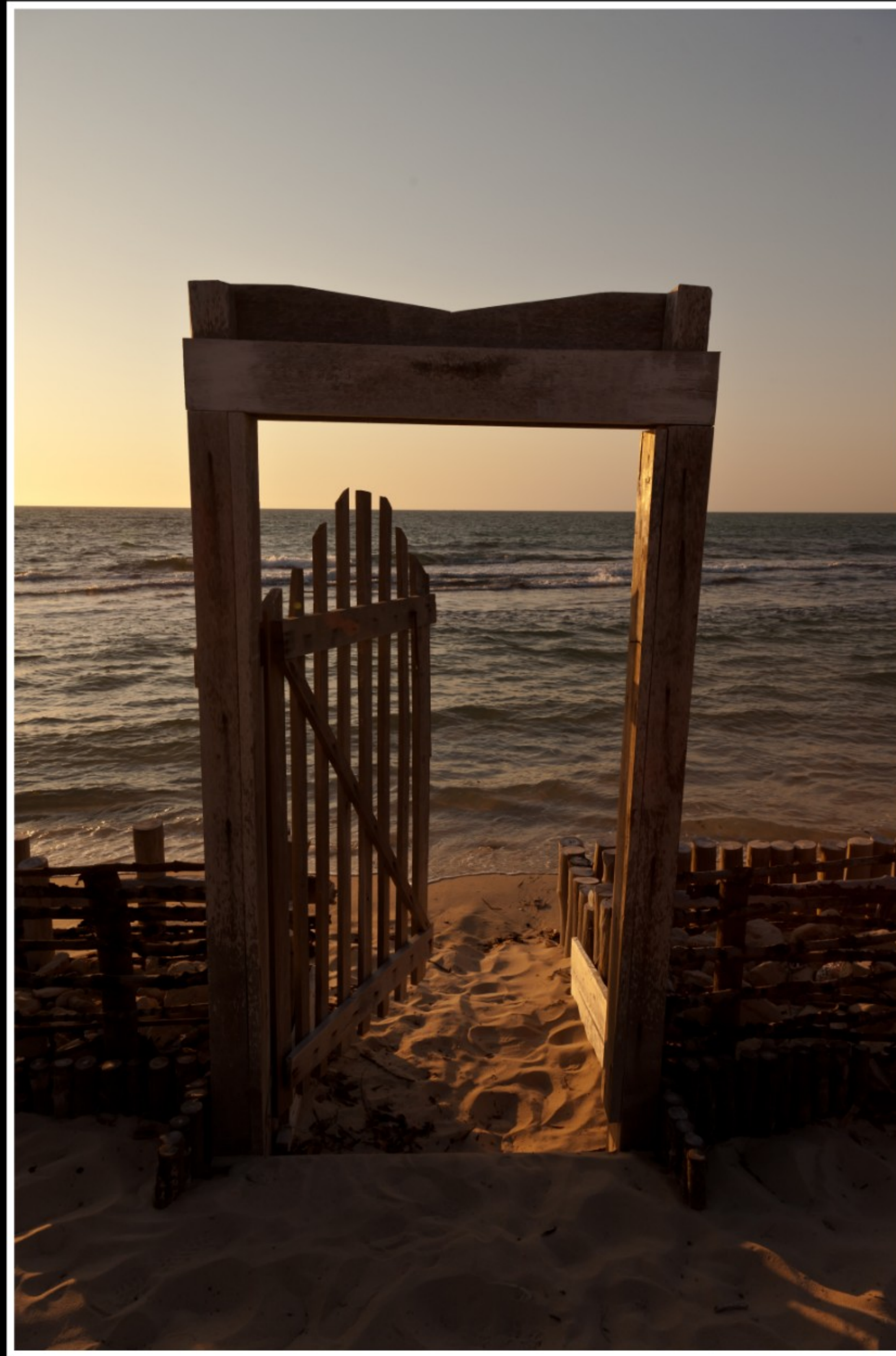
... IN BELO SUR MER ...