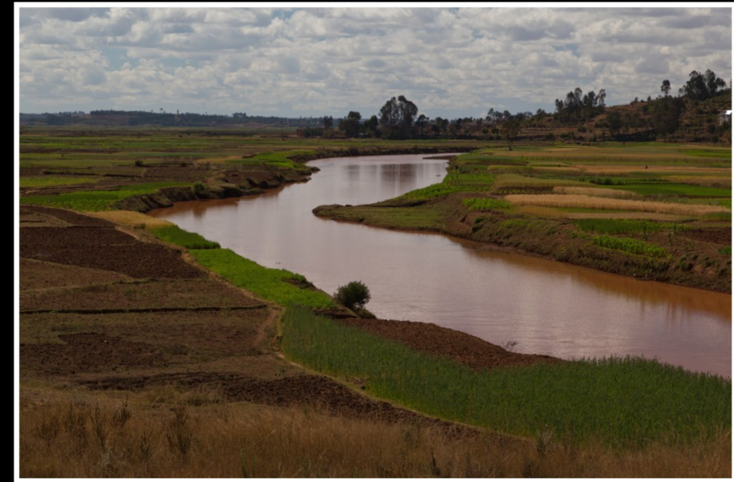
AUF DER FAHRT VON AMBOSITRA NACH ANTANANARIVO.