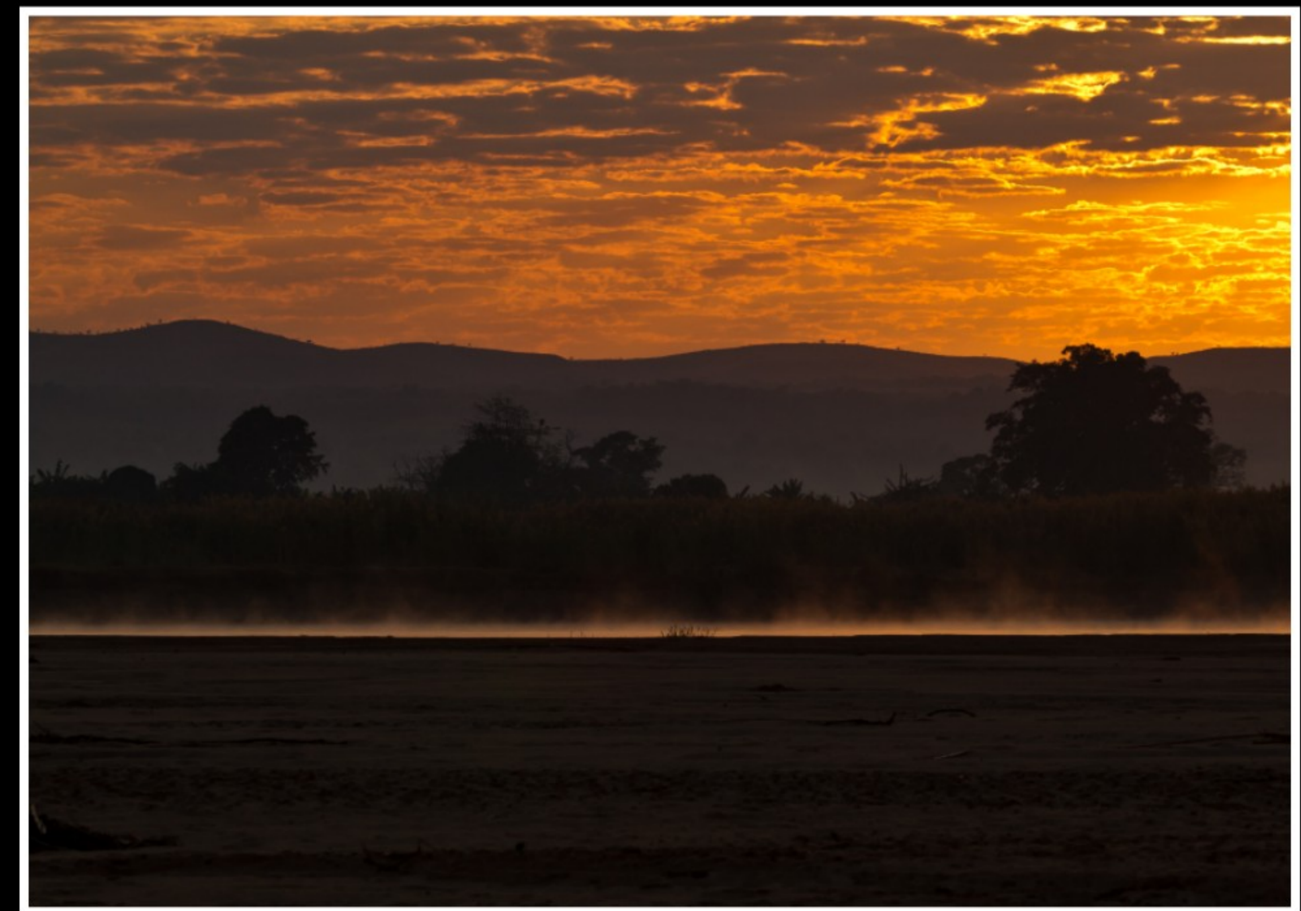
SONNENAUFANG UND -UNTERGANG AM FLUSS TSIRIBIHINA ...