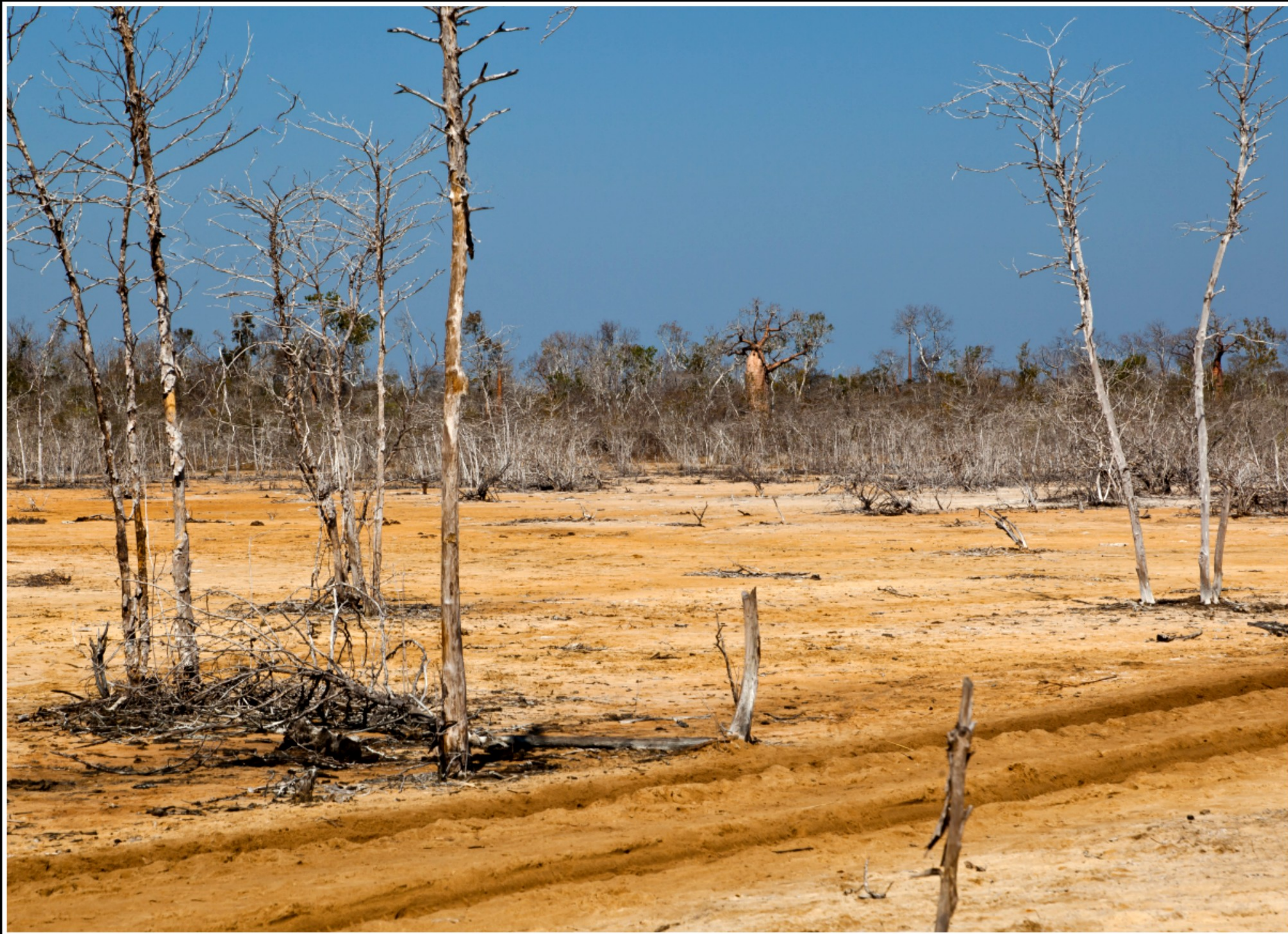
UNTERWEGS VON BEKOPAKA NACH MORONDAVA ...