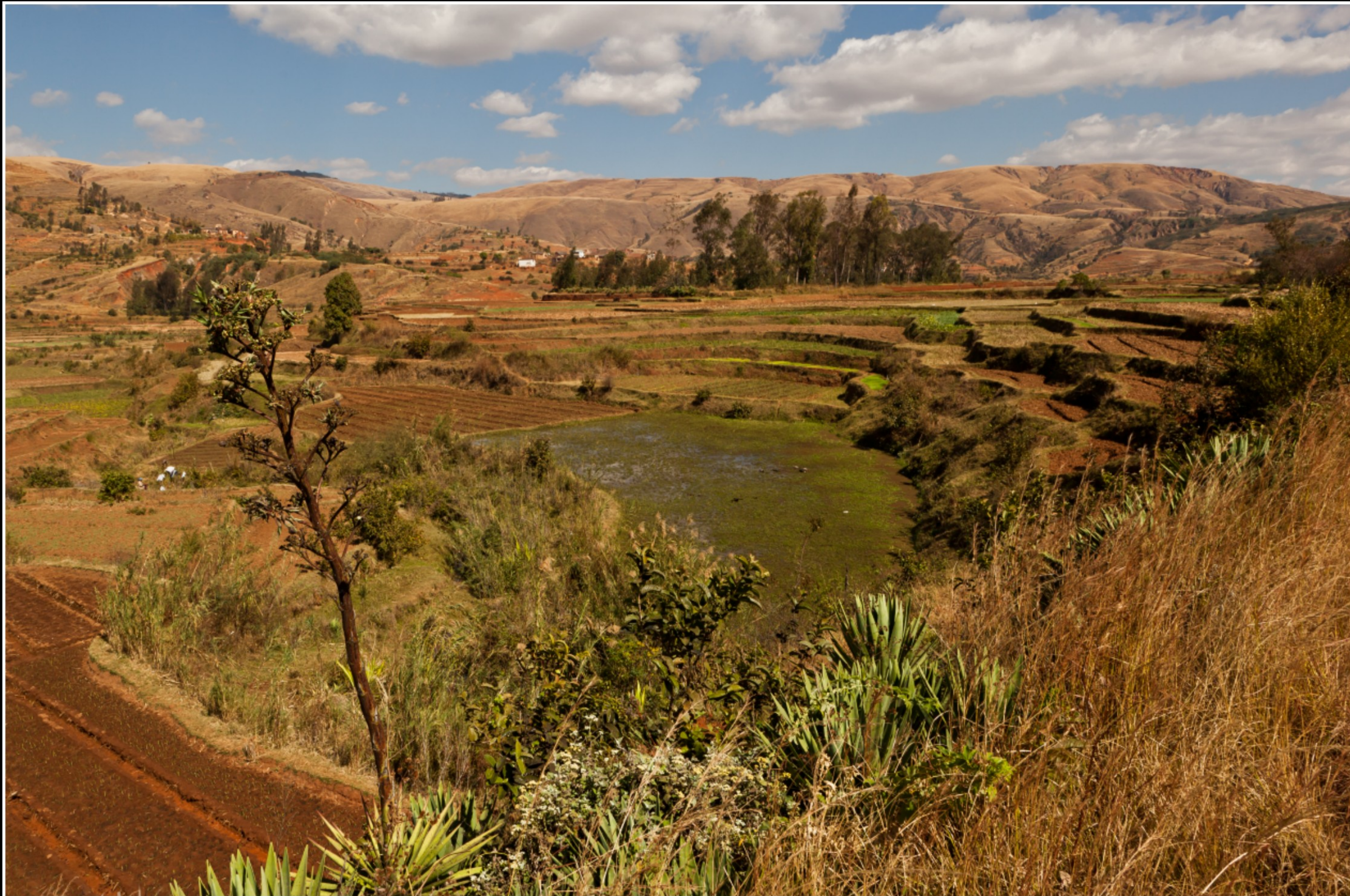
VON ANTSIRABE NACH MIANDRIVAZO ...