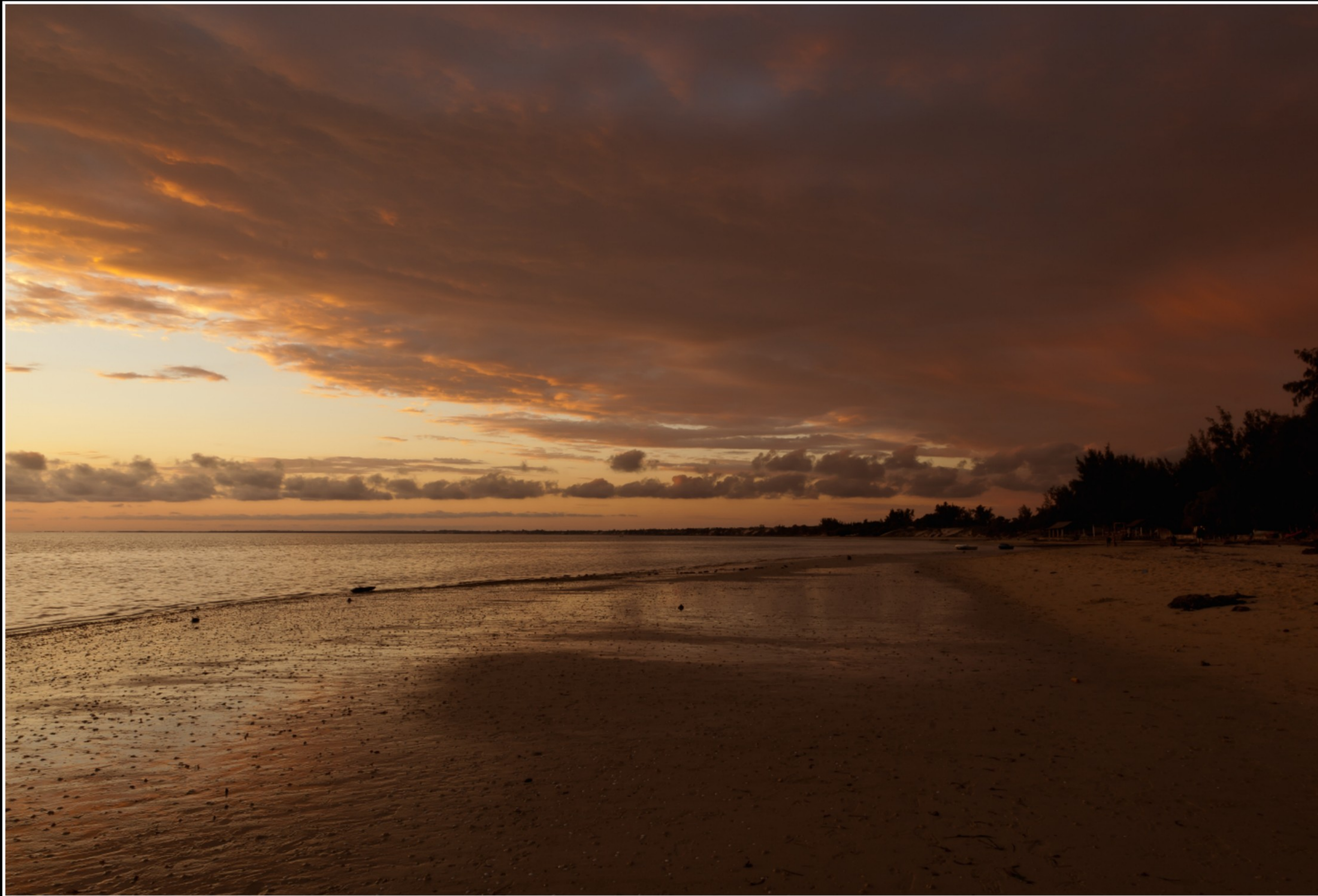
SONNENUNTERGANG IN IFATY ...