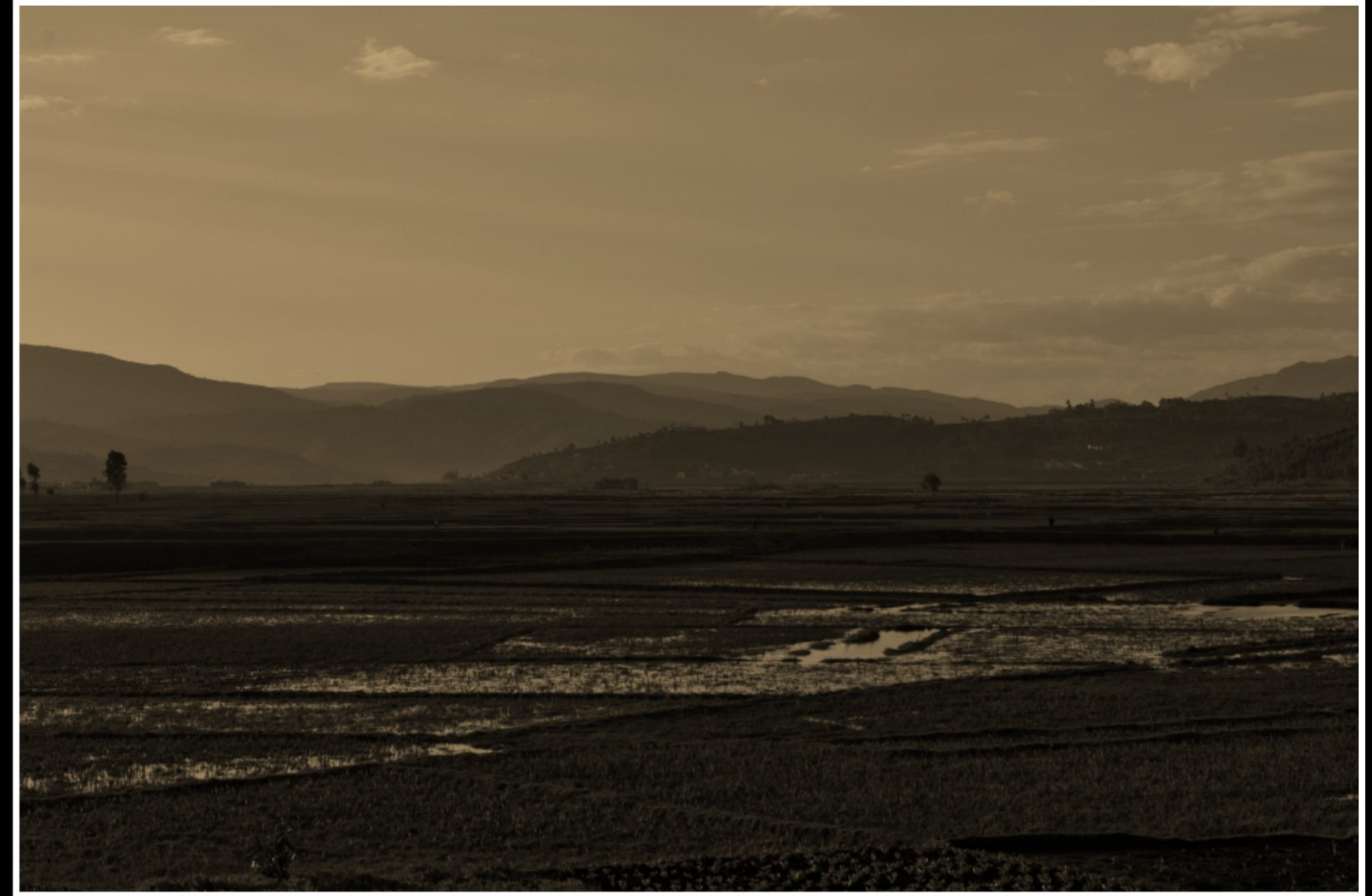
FAHRT VON ANTANANARIVO NACH ANTSIRABE ..