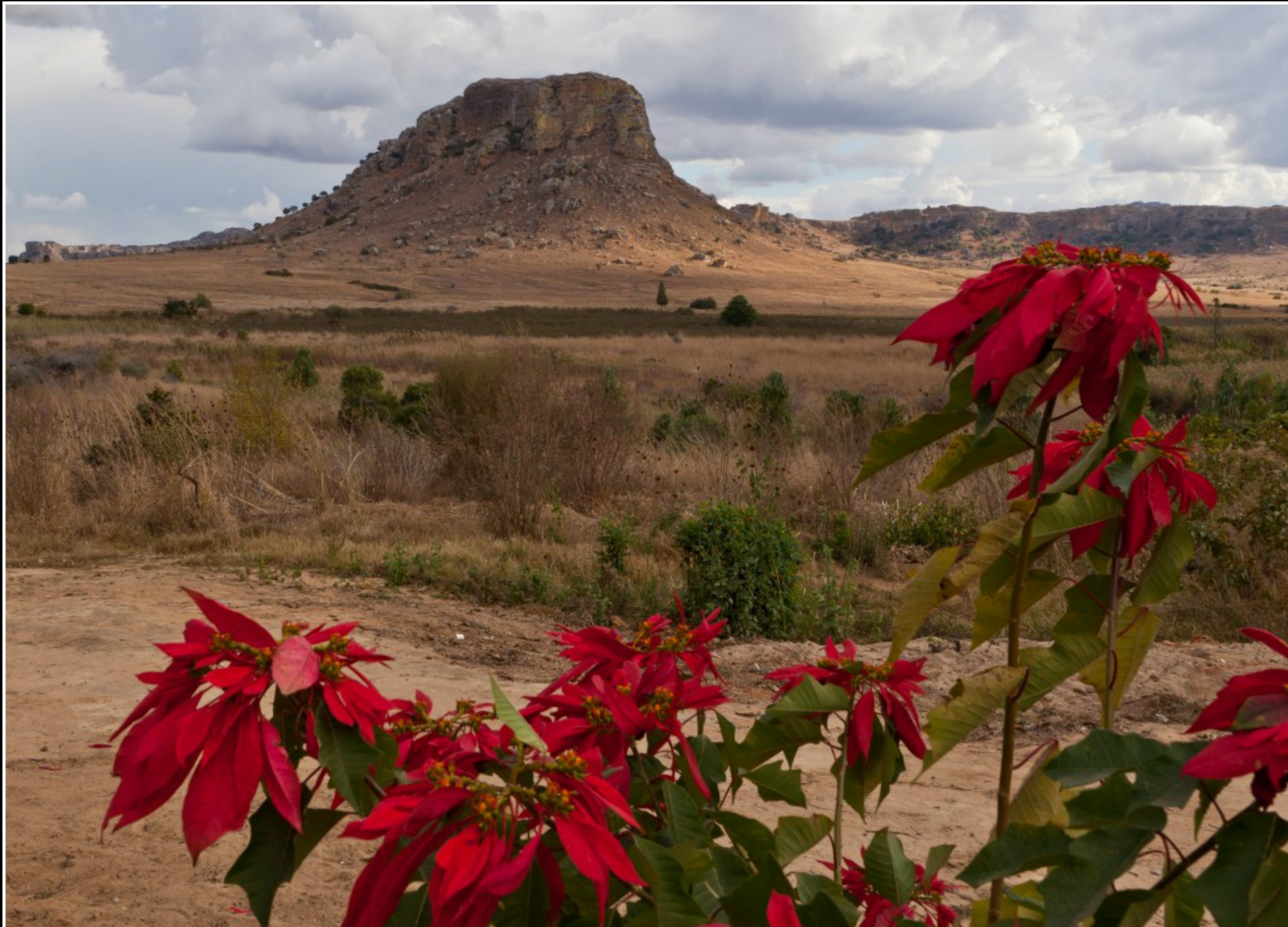
BLICK VOM HOTEL "ISALO RANCH"