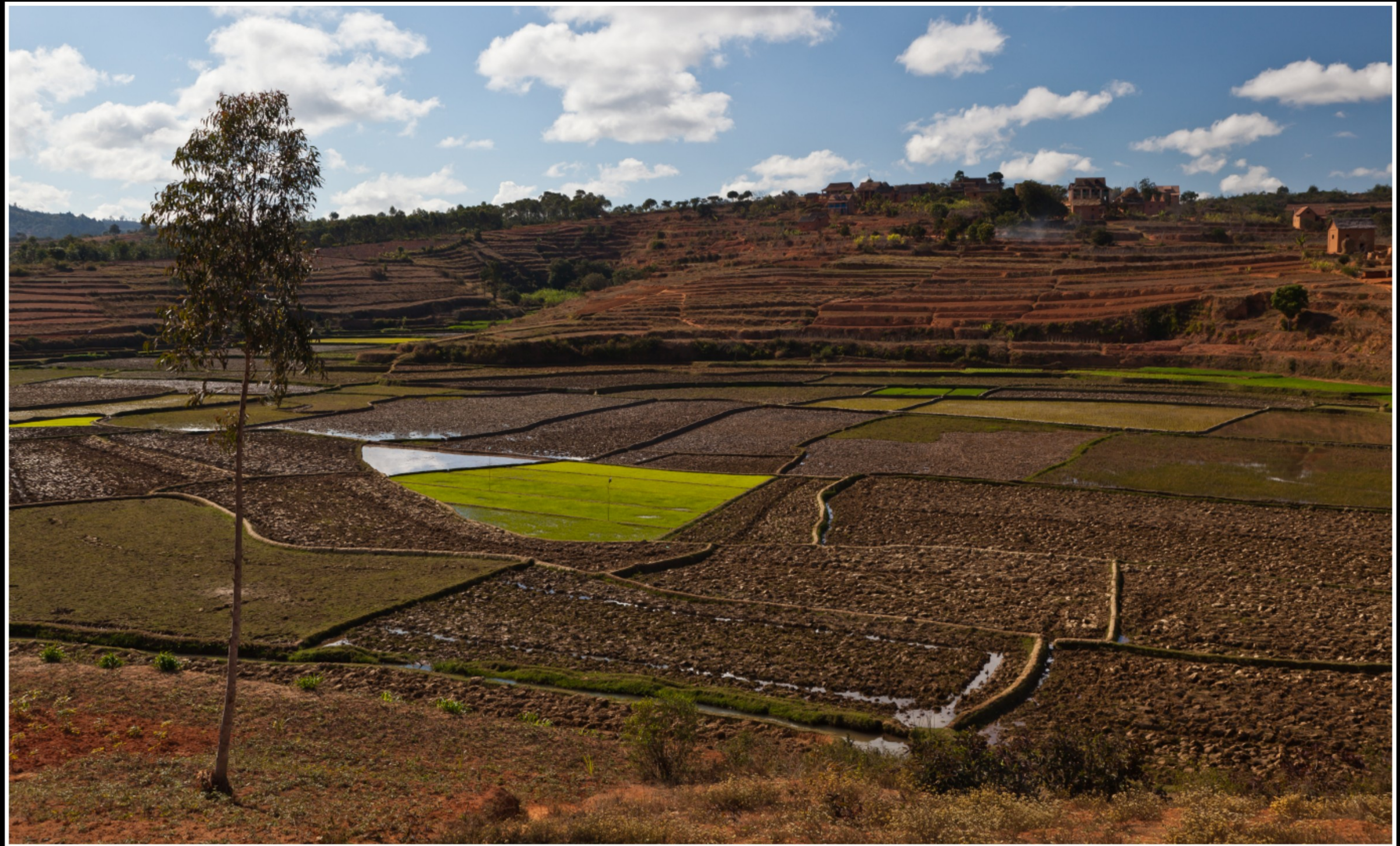
ZWISCHEN RANOMAFANA UND AMBOSITRA