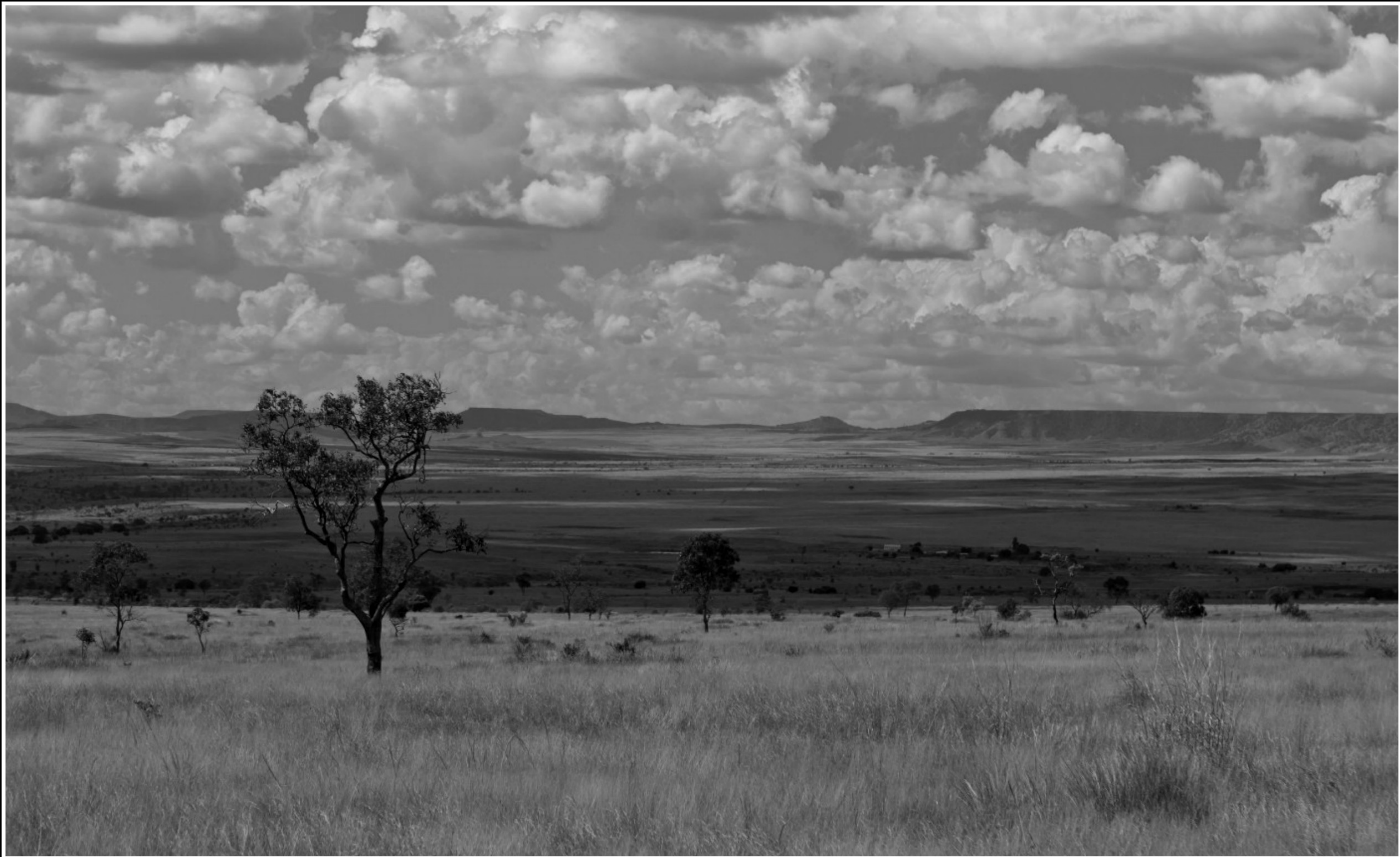
... UNTERWEGS ZWISCHEN TULEAR UND RANOHIRA ...