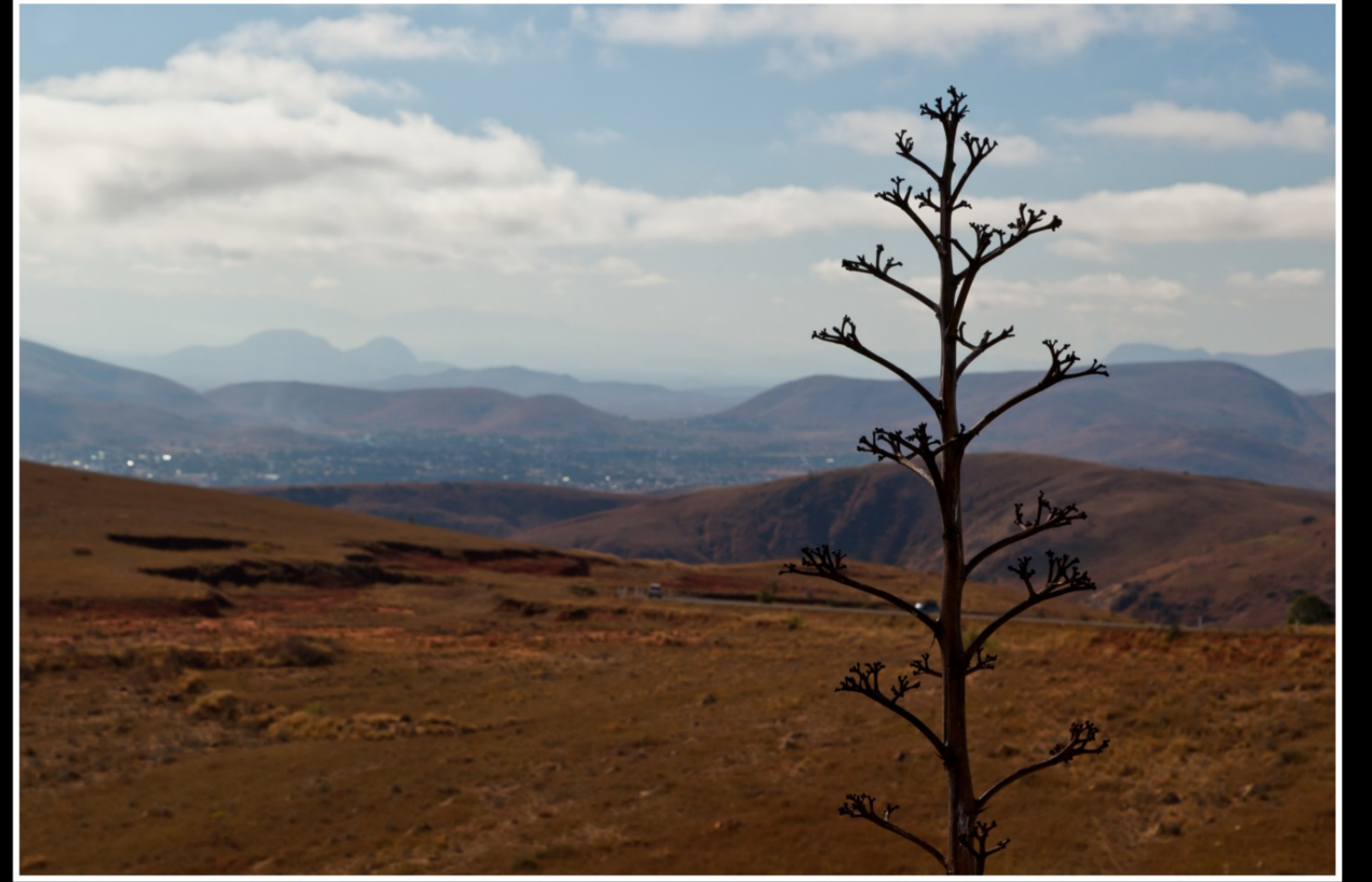
AUF DER FAHRT VON RANOHIRA NACH FIANARANTSOA ...